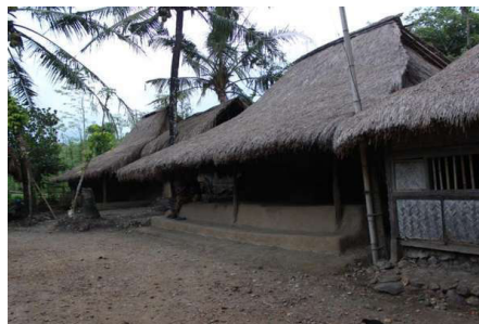
Gambar 2 Rumah Adat Bale Tani.

Suku sasak memiliki beberapa rumah adat. Diantaranya adalah rumah adat