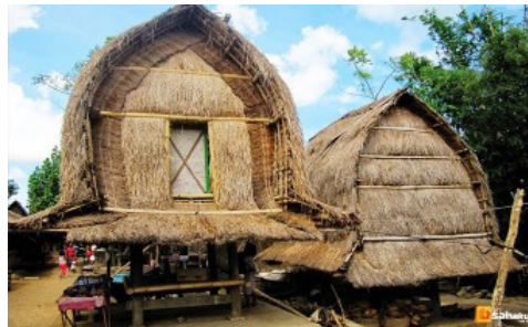
Gambar 1 Rumah Adat Bale Lumbung.

Arsitektur lokal tradisional merupakan arsitektur yang dibuat dengan cara yang sama secara turun-menurun dengan perubahan yang sedikit atau tanpa perubahan dan juga sering disebut sebagai arsitektur kedaerahan. Kata “tradisi” merupakan kata serapan yang berasal dari Bahasa latin yakni “trader” yang bermakna menyerahkan serta dari kata “traditium” yang berarti mewariskan. Pada dasarnya, arsitektur lokal tradisional dilandasi oleh tradisi budaya keseharian atau kepercayaan masyarakatnya. Arsitektur lokal tradisional merupakan identitas budaya suatu bangsa, karena didalamnya terdapat arti makna kehidupan masyarakatnya (Myrtha Soeroto, 2002:11). Peran arsitektur lokal tradisional dalam kehidupan masyarakat merupakan sebagai keseimbangan makroskop (alam semesta) dan mikroskop (bangunan) yang artinya, arsitektur lokal tradisional menyeimbangkan dan menjaga hubungan harmoni antara bangunan dan alam semesta.