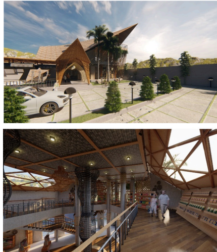
Gambar 10 Facade Toko Oleh-oleh

Berikut ini merupakan gambar-gambar visualisasi perpektif bangunan pada proyek toko oleh-oleh.