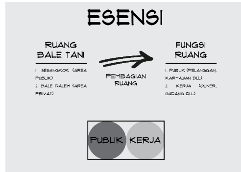
Gambar 4 Esensi

Esensi sendiri memiliki arti sebagai hakikat. Hakikat yang dimaksud pada konsep ini adalah hakikat pembagian ruang dalam bangunan rumah adat Bale Tani yang di aplikasikan pada konsep bangunan toko oleh-oleh khas Lombok. Esensi yang diambil adalah pembagian ruang privat dan publik yang ada pada rumah adat Bale Tani.