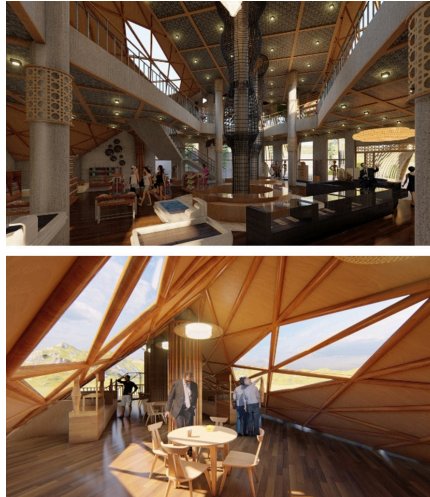
Gambar 11 Facade Toko Oleh-oleh