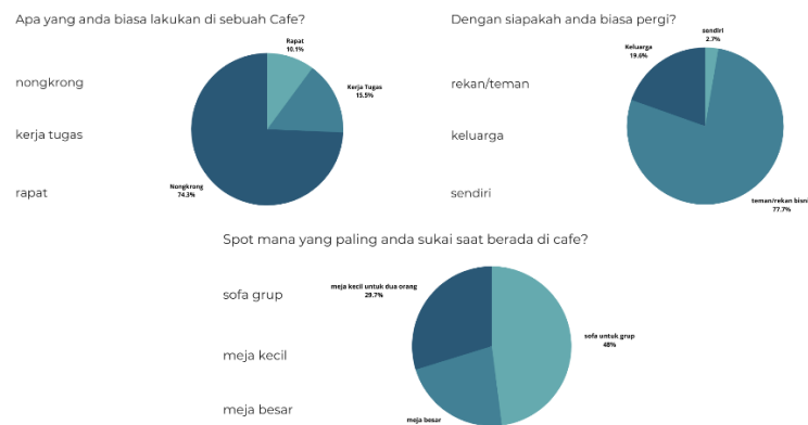
Gambar 3. Hasil kuisisioner online mengenai minat pengunjung yang datang ke Kafe pada masa pandemi Covid-19.

Dari sisi pengunjung sendiri, presentase angka masih menunjukkan rendahnya tingkat kesadaran penjunjung terhadap protokol kesehatan diarea Kafe. Sebanyak 30% pengunjung telah menaati dan 70% pengunjung kurang menaati protokol kesehatan dalam kafe tersebut, seperti : acuh terhadap pembatasan kapasitas duduk per-meja, tidak memakai masker diarea Kafe saat sedang tidak makan/minum, tidak menaati pembatasan pengunjung diarea Kafe, dan tidak cuci tangan dahulu sebelum memasuki area kafe. Hal ini menunjukkan bahwa kafe harus memiliki peraturan yang tegas untuk membuat pengunjung dapat lebih disiplin.