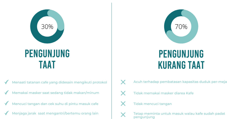
Gambar 4. Hasil presentase pengamatan perilaku pengunjung darea Kafe. (Sumber: Dokumen Pribadi, 2021).

C berada pada pinggir jalan dipusat kota. Hasil yang didapatkan menunjukkan bahwa desain tatanan dari ketiga kafe tersebut sudah melakukan adaptasi sesuai anjuran pemerintah dengan beberapa cara, seperti : terdapat wastafel dan area sanitizer didepan Kafe, mengurangi kapasitas meja, kursi berjarak 2 meter, dan lain-lain. Selain itu semua pelayan Kafe telah menerapkan protokol kesehatan dengan baik, seperti memakai masker, face shield, sarung tangan plastik, dan treatment kebersihan setelah pengunjung pergi dari Kafe. Selain itu, untuk kafe A juga memiliki beberapa fasilitas dan peraturan tambahan selama pandemi ini seperti menyediakan drive thru , pembatasan kapasitas pengunjung, pembatasan durasi dine in yaitu selama satu jam, serta menggunakan teknologi QR code untuk melihat menu.