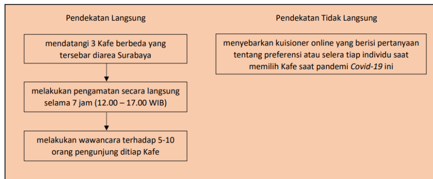
Gambar 1. Gambaran tahapan penelitian.

Metode penelitian ini adalah metode deskriptif dengan menggunakan dua pendekatan yaitu secara langsung dan tidak langsung. Untuk pendekatan secara langsung, dilakukan dengan mendatangi 3 Kafe, melakukan pengamatan selama 7 jam, yaitu pukul 12.00-17.00 WIB, dan wawancara terhadap 5-10 pengunjung di tiap Kafe. Dengan pemilihan 3 lokasi Kafe yang berbeda ini, penelitian dapat mengetahui beberapa perbedaan baik pada desain tatanan interior, perilaku pemilik, pelayan, dan pengunjung Kafe pada masa pandemi Covid-19. Sedangkan untuk pendekatan tidak langsung dilakukan dengan cara menyebarkan kuisisioner online yang berisi pertanyaan tentang preferensi atau selera tiap individu saat memilih Kafe saat pandemi Covid-19 ini. Instrumen yang digunakan dalam penelitian ini dibagi menjadi 3 instrumen utama, yaitu desain tata interior Kafe, perilaku pemilik/pelayan Kafe, dan perilaku pengunjung Kafe.