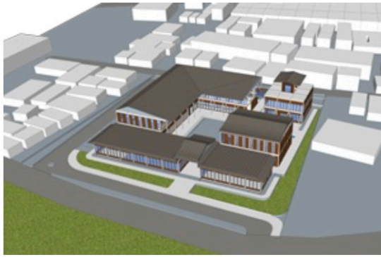
Gambar 2. Bird Eye View Bangunan Pusat Kebudayaan