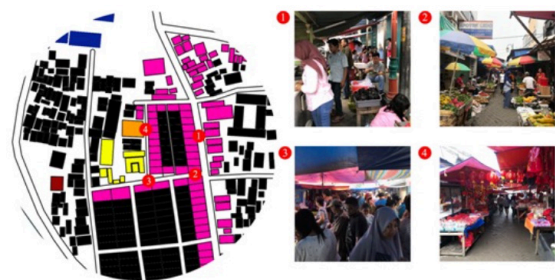
Gambar 1. Siteplan area tapak

Objek penelitian pusat kebudayaan yang dipilih adalah kawasan Pasar Lama Tangerang. Pada kawasan ini terdapat beberapa bangunan bersejarah yang membentuk kawasan serta kota Tangerang. Kawasan ini disebut sebagai pusat kebudayaan serta pusat wisata kuliner. Bangunan-bangunan bersejarah berupa klenteng, masjid, dan museum terletak saling berdekatan dan memiliki satu permasalahan utama yaitu terhalangi oleh kepadatan aktivitas masyarakat yaitu aktivitas perekonomian berupa pasar tradisional yang menggunakan ruang publik (jalan, pedestrian, hingga pekarangan permukiman dan bangunan-bangunan bersejarah) seperti yang dapat dilihat pada gambar 2.