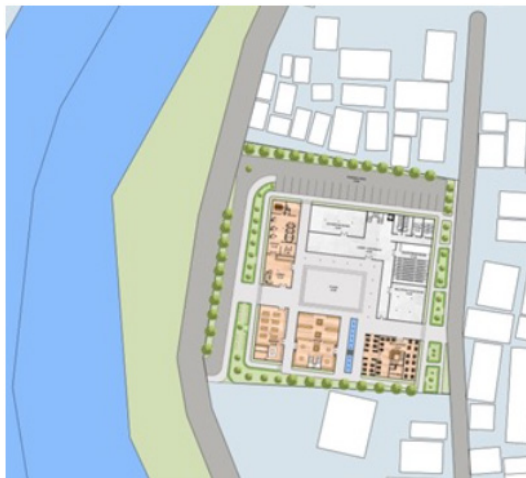
Gambar 4. Siteplan Pusat Kebudayaan