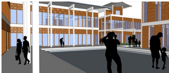
Gambar 3. Perspektif Suasana Area Plaza