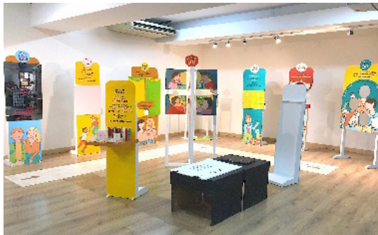
Gambar 3. Hasil Produksi Final Panel Instalasi Keseluruhan

yang berbeda, tetapi masih dihubungkan dengan kata-kata kunci yang ada.