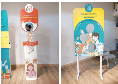
Gambar 8. Hasil Produksi Final Panel Avoid Being A Bank To Your Friends dan Different Friends For Different Situations

Panel terakhir berjudul Different Friends For Different Situations. Panel ini menggambarkan kelompok teman yang masing-masing memiliki pendekatan yang berbeda-beda. Keragaman tipe teman pada panel ini memberikan bayangan akan betapa menyenangkannya apabila memiliki teman yang berbeda-beda untuk tiap minat dan situasi yang berbeda pula.