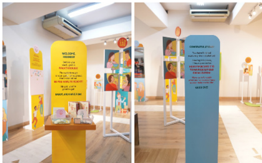
Gambar 4. Hasil Produksi Final Panel Start dan Finish

Bagian pertama dan terakhir yang ada pada instalasi ini adalah panel start dan finish . Kedua panel ini berfungsi sebagai penanda awal dan akhir dari instalasi, sekaligus memberikan informasi singkat akan apa yang diharapkan dari instalasi ini. Panel start memiliki tempat untuk meletakkan panduan instalasi di atasnya, agar audiens dapat mengambilnya sebelum masuk.