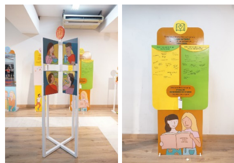
Gambar 6. Hasil Produksi Final Have A Candlelit Meal With Others dan Live A Memorable Life

Panel keempat berjudul Live A Memorable Life. Panel ini menuntut audiens untuk mengingat hal-hal berkesan apa saja yang sudah mereka lakukan, juga hal-hal berkesan apa yang belum tetapi mau mereka lakukan. Menuliskan hal berkesan yang sudah dilakukan dan yang mau dilakukan dapat menyegarkan ingatan audiens akan kehidupan mereka selama ini.