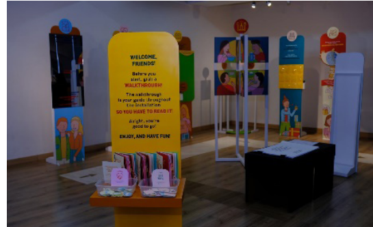
Gambar 9. Instalasi yang dirancang dalam Pameran "LOOK OVER"

respon yang cukup baik melihat adanya hasil interaksi pengunjung (tulisan, stiker, dll) yang terlihat dalam instalasi penulis. Namun karena keterbatasan waktu dan juga tempat pameran, maka jumlah interaksi yang didapatkan belum maksimal.