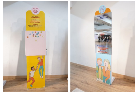
Gambar 5. Hasil Produksi Final Panel Make Friends dan Who Are Your True Friends?

ini adalah agar audiens dapat mengingat kembali siapa teman sejati mereka dan alasan mereka mencintai teman sejati mereka.