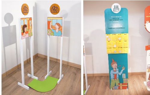
Gambar 7. Hasil Produksi Final Panel Final Meet Your Neighbours dan Remember Friends' And Family's Birthdays

untuk menulis nama dan tanggal dari ulang tahun sesama, kemudian memasukkannya ke dalam kantong-kantong bulan. Tujuannya adalah agar para audiens dapat lebih mudah mengingat hari-hari ulang tahun tersebut.