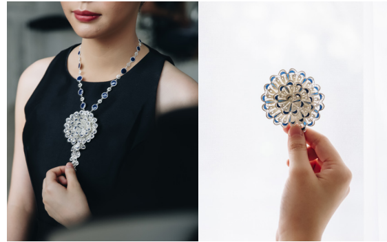
Gambar 3. Produk final.