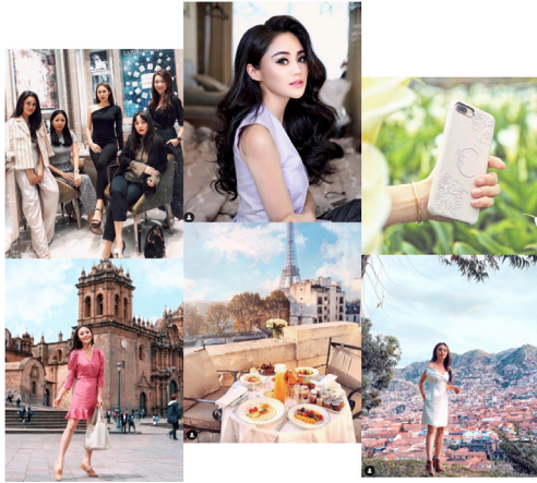
Gambar 2. Lifestyle pengguna.