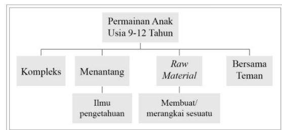
Gambar 4. Diagram Rangkuman Teori Permainan Anak Usia 9-12 Tahun (Sumber: Data Pribadi (2015))

(CPSC) atau Komisi Keamanan Produk Konsumen Amerika merupakan sebuah lembaga pengawas independen yang bertugas untuk menjaga publik dari risiko kecelakaan dan kematian tak beralasan yang menyangkut produk konsumen. Sebagai bagian dari misinya, pada tahun 2002 CPSC mengeluarkan sebuah pedoman berjudul “Age Determination Guidelines: Relating Children’s Ages to Toy Characteristics and Play Behavior” yang bertujuan untuk memberikan panduan dalam memilih (tipe per-) mainan sesuai dengan target usia anak, yang dilandaskan pada perkembangan diri anak pada umumnya.