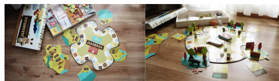
Gambar 5. Foto Produk Jadi

Setelah melewati sejumlah proses studi, seperti studi ergonomi, dummy , material, warna, dan konstruksi, disertai dengan pengembangan sketsa dan alternatif desain, lahirlah sebuah permainan board games yang diberi nama Jagawana (penjaga hutan/forest ranger).