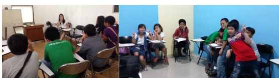
Gambar 2. Diskusi Kelompok

yang terdiri dari siswa-siswi kelas 4-6 SD dari berbagai sekolah di daerah Tangerang dan sekitarnya. Diskusi kelompok dilakukan dengan pertimbangan agar anak-anak dapat lebih terbuka saat menjawab (lebih interaktif, berani) karena mereka melakukannya bersama-sama, juga untuk memancing jawaban-jawaban atau respon tambahan saat anak mendengar jawaban dari temannya.