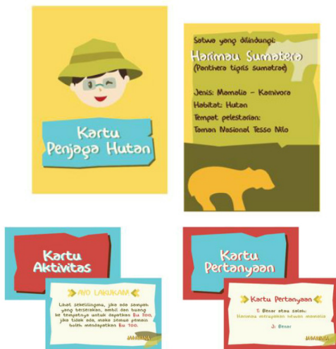
Gambar 6. Kartu Penjaga Hutan, Kartu Aktivitas, Kartu Pertanyaan

pemain. Tujuan teknisnya yaitu, setiap pemain berperan sebagai seorang jagawana (penjaga hutan) dan bertugas untuk menciptakan lingkungan tempat tinggal yang layak bagi satwa yang dimilikinya. Tempat tinggal ini berupa sebuah “taman nasional” yang di dalamnya memerlukan makanan, pohon (melambangkan lingkungan hijau yang layak), pagar (melambangkan penjagaan), dan penjaga. Untuk dapat “membeli” berbagai keperluan tersebut, pemain harus mengumpulkan uang yang didapat dari menjawab pertanyaan dalam “Kartu Pertanyaan” atau menjalankan tugas dalam “Kartu Aktivitas”.