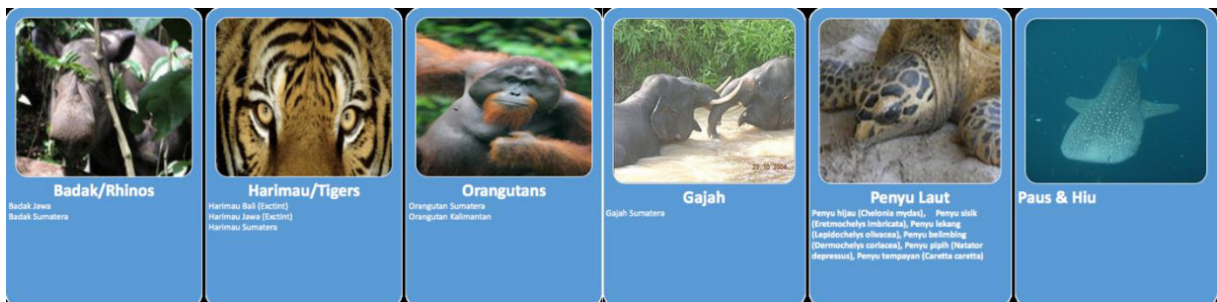
Gambar 1. Satwa Payung

Penulis melakukan diskusi kelompok ( group discussion ) bersama dengan total 30 anak