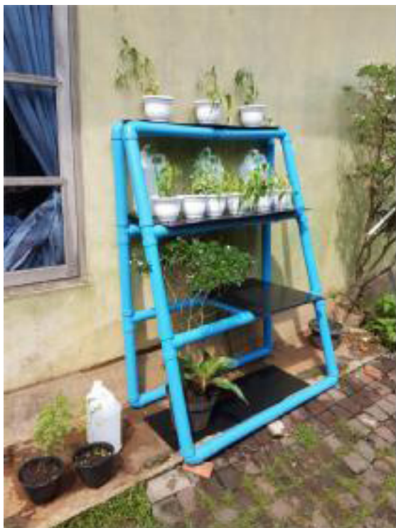
Gambar 3. Sistem pengairan portabel diletakkan pada rak vertikal

Proses pembentukan solusi desain dimulai dari percobaan dengan bahan-bahan. Lalu, kami membuat sketsa awal desain tersebut dan diasistensikan. Kemudian dilakukan percobaan untuk menguji keberhasilan solusi; dalam sistem pengairan menggunakan sistem kapiler dengan berbagai alternatif kain (kain katun, kain flanel) dan selang (selang aquarium, selang conduit, selang pembuangan AC), sementara dalam rak vertikal kami menguji kesesuaian rak tersebut langsung di rumah Ibu Amel. Setelah pengujian berhasil, kami membuat sketsa final dari desain tersebut dalam bentuk 3D, dan merevisi desain asli kami dengan mempertimbangkan.