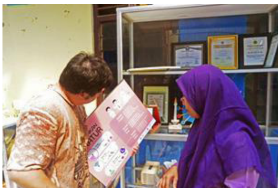
Gambar 7. Situasi pada saat diskusi dan feedback.

Setelah hasil desain awal dibentuk, peneliti kembali berdiskusi dengan kepala sekolah dan guru di sekolah Unwaanunnajah, Pondok Pucung. Peneliti mendapatkan beberapa feedback atau masukan dari mereka. Masukan tersebut berupa pakaian ilustrasi siswa Pondok Pucung disarankan diubah menjadi seragam sekolah untuk hari lain agar terlihat lebih varian. Kemudian penggunaan bahasa, logika kalimat, dan kejelasan informasi pada poster “Pola Makan Seimbang” (gambar 4) masih perlu diperbaiki karena sulit dipahami oleh siswa.