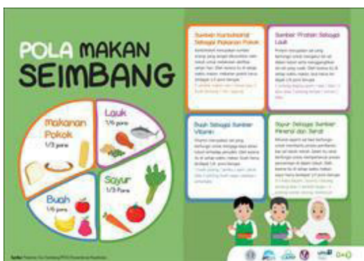
Gambar 8. Hasil akhir desain poster pola makan seimbang

Dalam proses penyempurnaan desain poster beragam jenis gizi dalam makanan diberikan masukan mengenai penjelasan vitamin dan protein yang kurang jelas, juga mengenai desain logo yang berbaur dengan background sehingga tidak terlihat, dan juga judul yang kurang jelas mengenai gizi.