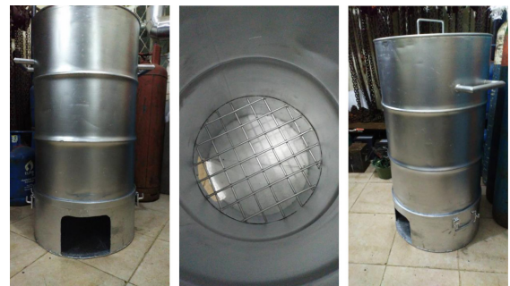
Gambar 2. Tungku Untuk Pembakaran Sampah

Tungku pembakaran sampah diperlukan saat ini sebagai solusi sementara. Pembuatan Tungku pembakaran sampah ini tidak dapat secara maksimal menghilangkan polusi asap, namun dapat mengurangi jumlah asap. Bagian tungku berhan plat besi yang tebal dan kokoh sehingga masih dapat bertahan untuk beberapa waktu. Pada tutup tungku terdapat pegangan yang memudahkan pengguna dalam memakai. Terdapat stiker instruksional tentang cara penggunaan.