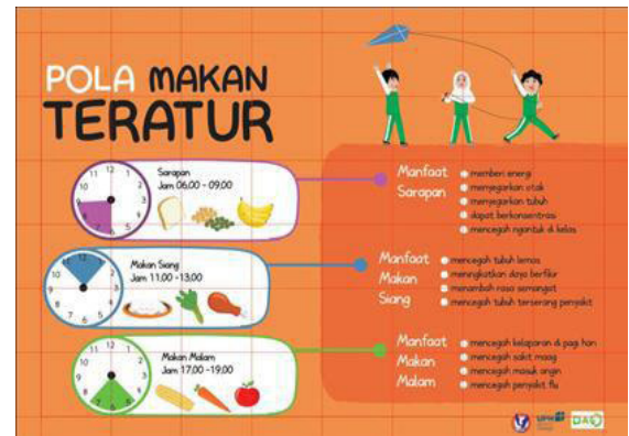
Gambar 6. Grid hasil awal desain poster pola makan teratur

kebersihan, yaitu mencuci tangan dengan bersih sebelum makan, dan menjaga kualitas makanan yang dimakan tetap bersih agar tidak terkena penyakit.