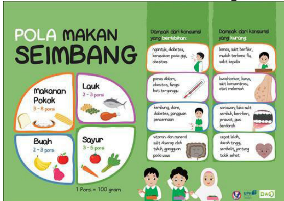
Gambar 4. Hasil awal desain poster pola makan seimbang

Poster ini dirancang untuk menginformasikan Pedoman Gizi Seimbang (PGS) yang dibentuk oleh Kementerian Kesehatan RI. PGS menyatakan bahwa pola makan yang baik dan sehat adalah dengan mengombinasikan makanan pokok, lauk, buah, dan sayur ke dalam satu porsi makan. PGS menjelaskan bahwa dalam satu hari anak berusia 6-12 tahun membutuhkan makanan pokok dan sayur sebanyak 3-8 porsi (300-800 gram), 3 porsi dalam satu kali makan dan 8 porsi dalam 3 kali makan. Kemudian lauk dan buah dengan porsi 2-3 porsi (200-300 gram), 2 porsi dalam satu kali makan dan 3 porsi dalam satu hari makan. Selain itu PGS juga menekankan agar anak mengkonsumsi makanan yang beragam demi memenuhi gizi dan energi bagi tubuh.