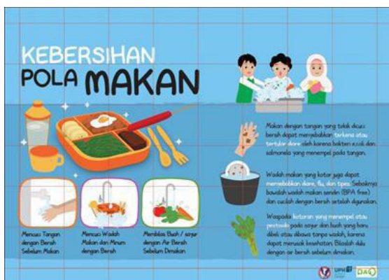
Gambar 5. Grid hasil awal desain poster pola makan bersih

Poster ini dirancang untuk menginformasikan Pedoman Gizi Seimbang (PGS) yang dibentuk oleh Kementerian Kesehatan RI. PGS menyatakan bahwa pola makan yang baik dan sehat adalah dengan mengombinasikan makanan pokok, lauk, buah, dan sayur ke dalam satu porsi makan. PGS menjelaskan bahwa dalam satu hari anak berusia 6-12 tahun membutuhkan makanan pokok dan sayur sebanyak 3-8 porsi (300-800 gram), 3 porsi dalam satu kali makan dan 8 porsi dalam 3 kali makan. Kemudian lauk dan buah dengan porsi 2-3 porsi (200-300 gram), 2 porsi dalam satu kali makan dan 3 porsi dalam satu hari makan. Selain itu PGS juga menekankan agar anak mengkonsumsi makanan yang beragam demi memenuhi gizi dan energi bagi tubuh.