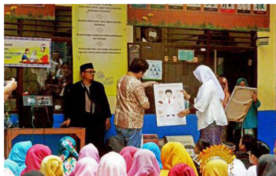
Gambar 9. Hasil desain poster lainnya

Poster-poster ini kemudian diberikan ke pihak sekolah Unwaanunnajah dalam rangka acara penyerahan hasil karya poster-poster.