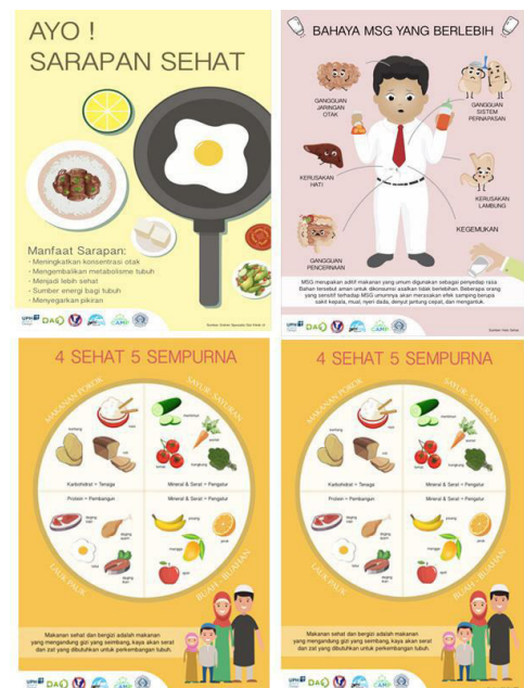
Gambar 6. Grid hasil awal desain poster pola makan teratur

Poster ini ditujukan untuk melengkapi tema poster menjadi 3 pola dalam satu sistem. Informasi ini sangat penting serta berhubungan dengan menjaga kesehatan melalui pola makan dan membiasakan siswa untuk memilih makanan yang sehat. Informasi ini berisikan tentang waktu makan yang baik dalam jangka 24 jam serta manfaat-manfaatnya untuk prestasi, aktifitas, dan daya tahan tubuh. Konsep poster beragam jenis gizi dalam makanan diambil dari pedoman gizi seimbang, selain porsi-porsi makanan yang seimbang ada juga makanan-makanan yang memiliki kandungan gizi yang sama baiknya dengan makanan yang ada dalam 4 sehat 5 sempurna.