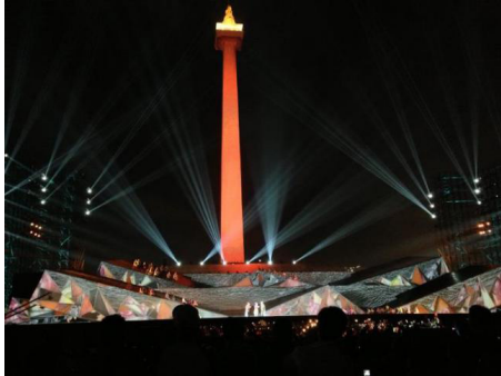
Gambar 4: Penerapan Video Mapping

Dapat dikatakan bahwa ilusi optik yang kemudian mengubah persepsi kita terhadap bentuk dan perspektif ini turut mempengaruhi persepsi kita terhadap suatu bangunan sebagai karya arsitektur. Fasad bangunan yang cenderung datar dan monoton menjadi terasa lebih hidup dengan bantuan teknologi proyeksi video mapping .