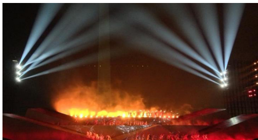
Gambar 5: Penerapan Efek Pyrotechniques

Panggung terbuka dilapangan Monas, juga memungkinkan rancang panggung menggunakan efek pyrotechniques , efek ini menggunakan kembang api, efek nyala api berwarna setinggi enam meter dengan gas LPG. Efek ini berhasil membuat tampilan visual yang dramatis dan memukau dalam salah satu adegan di pertunjukan Ariaiah.