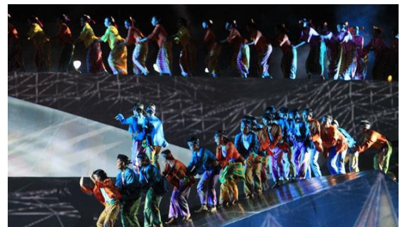
Gambar 1: Pertunjukan Ariaah

Seni pertunjukan Ariaah Pertunjukan Ariaah yang ditampilkan sebagai peringatan ulang tahun kota Jakarta ke 486 di tahun 2013, merupakan seni pertunjukan yang menggabungkan seni tradisi Betawi dengan tampilan yang lebih kontemporer. Penggagas pertunjukan akbar ini adalah gubernur kota Jakarta pada saat itu, Bapak Joko Widodo. Pertunjukan ini dipergelarkan di pelataran Monument Nasional Monas, merupakan pergelaran kolosal dengan didukung oleh 200 penari dan 120 pemain musik.