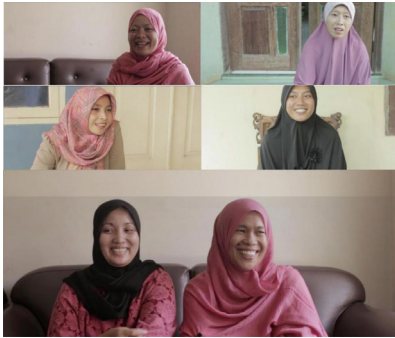
Gambar 3. Kegiatan Interview pada saat syuting berlangsung.

Berikut adalah potongan gambar dari beberapa ibu yang di interview.