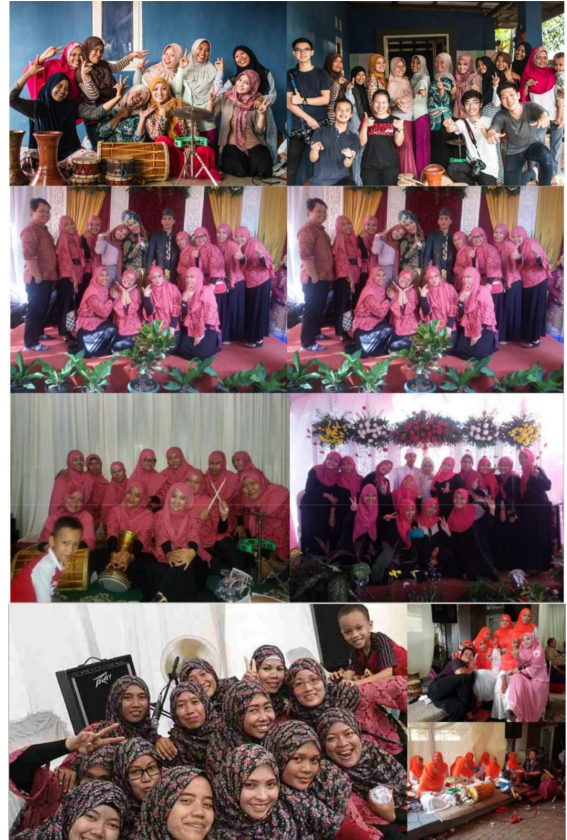
Gambar 6. Kegiatan Marawis

Dari hasil dokumenter yang kami buat, hal tersebut cukup dapat memberikan gambaran besar tentang keberadaan kelompok marawis ibu-ibu Pondok Pucung. Isi documenter ini menunjukkan identitas yang dimiliki kelompok tersebut sebagai suatu kelompok music yang terdiri dari yang awalnya hanya iseng menjadi sebuah perkumpulan yang menghasilkan suatu karya yang dapat membawa hikmah dan menyebarkan pesan moral melalui lagu yang dibawakan.