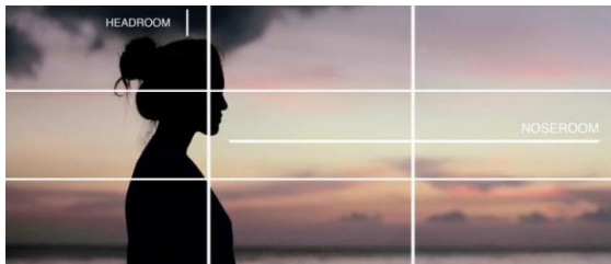
Gambar 1. Contoh Komposisi Rule of third

Kontinuitas dari konten berlaku pada segala hal yang terlihat pada sebuah adegan seperti : pakaian, gaya rambut, property, aktor, dsb. Kontinuitas dari pergerakan berlaku pada segala hal yang bergerak pada sebuah adegan, pergerakan tersebut tidak boleh memiliki perbedaan antara satu ke selanjutnya. Kontinuitas dari posisi berhubungan dengan awal dan akhir dari posisi suatu hal pada sebuah adegan. Kontinuitas dalam waktu berhubungan dengan aliran waktu dalam sebuah adegan. (Brown, Blain, 2012: 77-80).