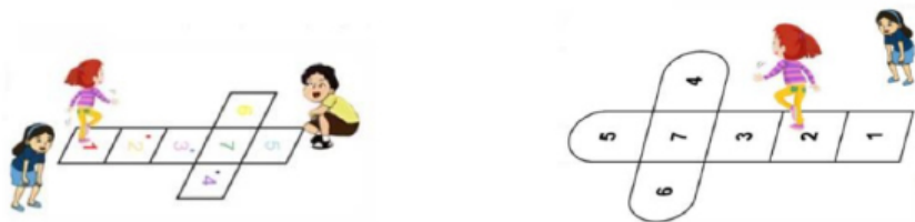
a. Bentuk area " ingkling " persegi.