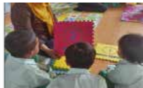
b. Berhitung berkelompok dengan angka yang ada pada puzzle ingkling