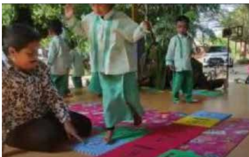
Gambar 5 Saat Anak Bermain Menginjak Huruf pada Area Ingkling.

Selanjutnya untuk belajar membaca huruf atau kata, anak juga dapat diajarkan dengan menggunakan kata yang ada di puzzle area ingkling saat bermain ingkling bersama guru atau pendamping. Pada saat anak menginjak area ingkling maka kata atau huruf apa yang ada bisa ditanyakan kepada anak untuk menjawabnya.