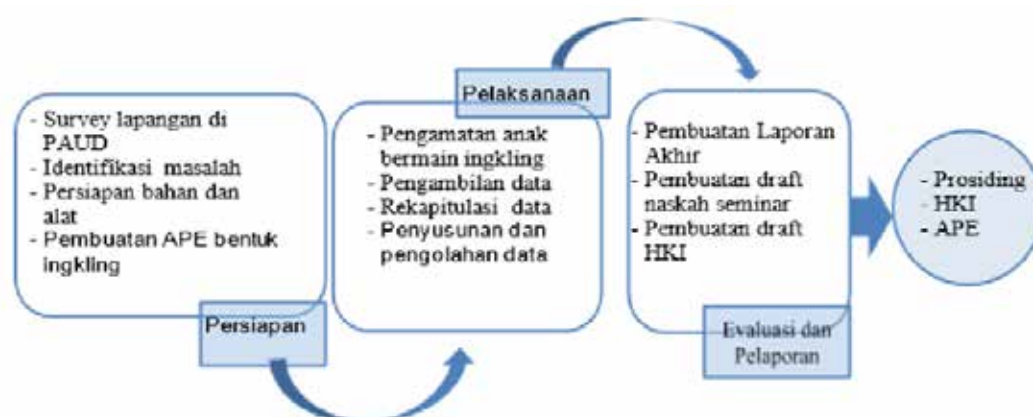
Gambar 3 Diagram Alur Penelitian.

Secara skematis alur penelitian ini ditunjukkan dengan diagram Gambar 3. Pembuatan alat pembelajaran berupa APE dari bahan sponati yang dibentuk puzzle yang bertuliskan angka, huruf atau kata dan diberi warna yang berwarna warni yang bisa menimbulkan daya tarik bagi anak-anak. Data ini diperoleh dari hasil wawancara, observasi, dan dokumentasi sebelum permainan dan sesudah permainan. Setelah diperoleh data kemudian dianalisis dengan cara mengorganisasi data yang diperoleh ke dalam sebuah kategori tentang keberhasilan yang ada.