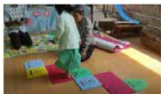
c. Berhitung saat anak menginjak arena ingkling

ingkling untuk menjumlahkan atau mengurangi angka-angka yang ditunjukkan guru. Dari kedua metode pembelajaran berhitung ini akan memberikan variasi pada anak cara belajarnya dengan menggunakan permainan tradisional ingkling .