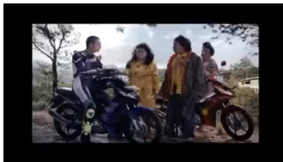
Gambar 1 Iklan Motor Yamaha Jupiter MX.

Iklan ini muncul di TV pada tahun 2009, saat Yamaha ingin mempromosikan motor Jupiter MX bersama Valentino Rossi dan artis Komeng. Visual Valentino Rossi di sini ditampilkan sebagai pengendara sepeda motor Jupiter MX, menggunakan perlengkapan balap seperti helm, wearpack , gloves, dan boots, dengan slogan iklannya yaitu “Semakin Di Depan”. Pada iklan ini diceritakan ada 3 orang yang sedang di pinggir jalan lalu secara tiba-tiba ada motor melaju dengan kencang sehingga membuat baju ketiga orang tersebut berantakan. Setelah itu pengendara yang membawa motor dengan kencang itu berhenti dan menghampiri ke tiga orang tersebut, salah satu dari ketiga orang itu bernama Komeng memarahi pengendara tersebut namun ketika pengendara tersebut melepas helmnya dan ternyata itu seorang bule, Komeng langsung merubah nada bicaranya dengan lembut dan mengatakan “Ngebut-ngebut kaya Valentino Rossi aja” lalu bule tersebut mengakui kalau dia Valentino Rossi, setelah tau itu Valentino Rossi mereka langsung merasa senang. Iklan ini menggambarkan bahwa Valentino Rossi sebagai seorang yang sudah dikenal dan sedang menggunakan atribut wearpack yang sedang melaju kencang menggunakan motor Yamaha Jupiter MX. Pada keseluruhan iklan tersebut, Yamaha menggunakan sosok Valentino Rossi sebagai brand ambassador yang membawakan citra motor Yamaha Jupiter MX adalah motor yang memiliki tenaga yang kencang. Iklan ini berdurasi 45 detik.