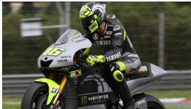
Gambar 2 Valentino Rossi Winter Test 2013.

yang kesulitan ingin naik ke atas panggung juga. Setelah itu Valentino Rossi dan Jorge Lorenzo membantu Komeng naik dan berselebrasi bertiga di atas panggung. Pada iklan ini Valentino Rossi digambarkan sebagai sosok Valentino Rossi yang menggunakan atribut wearpack sebagai pembalap MotoGP yang sedang berdiri seperti di atas podium ditambah dengan tampilan visual ketika mengendarai motor balapnya yang menjadi background . Secara keseluruhan pada iklan ini Yamaha menunjuk Valentino Rossi dan rekan satu timnya Jorge Lorenzo sebagai brand ambassador mereka, pada iklan ini Yamaha ingin membawakan livery special edition MotoGP ke pilihan motor produksi massal yang nanti bisa di beli oleh para konsumen. Iklan ini berdurasi 30 detik.