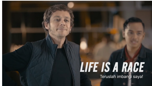
Gambar 7 Iklan Yamaha Aerox 125LC – Chapter 2 : Live is A Race.

Iklan bertujuan untuk menginformasikan dan mempengaruhi konsumen agar konsumen dapat menyukai atau membeli produk yang diiklankan. Pada iklan-iklannya, Yamaha memanfaatkan Valentino Rossi sebagai brand ambassador mereka dengan juga menggandeng artis lokal Indonesia. Pada iklan tersebut digambarkan sosok Valentino Rossi merupakan seorang yang sudah dikenal sebagai pembalap yang menggunakan dan mempromosikan keunggulan dari produk Yamaha untuk produksi massal yang digunakan di kegiatan sehari-hari sesuai teknologi dan inovasi yang ditawarkan dari brand motor Yamaha itu sendiri.