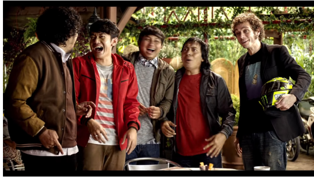
Gambar 3 Iklan Valentino Rossi Fuel Injection .