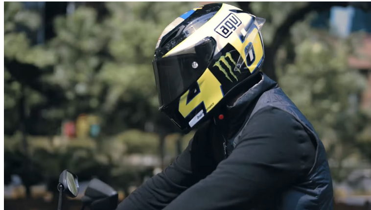
Gambar 6 Iklan Yamaha Aerox 125LC – Chapter 1 : The Designer .

digambarkan sebagai pembalap MotoGP yang digemari oleh seorang, lalu seorang tersebut bertemu dengan Valentino Rossi yang digambarkan sebagai pengendara motor Yamaha Aerox 125LC, yang menggunakan helm desain milik dirinya. Secara keseluruhan, pada iklan ini Valentino Rossi dijadikan brand ambassador oleh Yamaha untuk mempromosikan motor Yamaha Aerox 125LC, motor berwarna abu-abu merah ini dikendarai oleh seorang pria penggemar Valentino Rossi dan motor biru dikendarai oleh Valentino Rossi itu sendiri, Yamaha mengiklan motor ini untuk menaikkan citra motor Yamaha Aerox 125LC sebagai motor yang cepat, dan motor yang lincah. Iklan ini berdurasi 3 menit 8 detik.