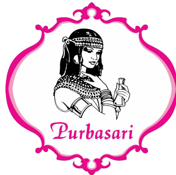
Gambar 2 Logo Brand Purbasari.

oleh konsumen sejak lama. Pernyataan ini dibuktikan dari adanya salah satu produk andalan Purbasari skincare yaitu lulur mandi yang mendapatkan penghargaan menjadi produk favorit.