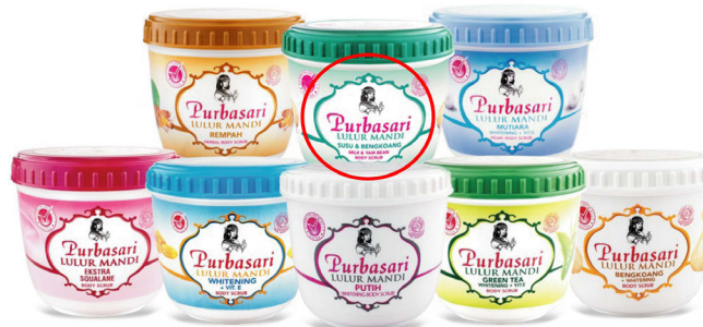
Gambar 7. Analisa Visual Aneka Produk Lulur Mandi Purbasari (Sumber : Aurelia, 2021)

Tidak hanya di situ, setelah melakukan observasi lebih dalam penulis juga menemukan adanya permasalahan hierarki dari informasi produk khususnya pada desain kemasan produk lulur mandi Purbasari (Gambar 7). Pada desain kemasan produk tersebut, tidak terlihat adanya poin utama yang ingin ditonjolkan mengenai produk. Sehingga ketika mata audience melihat, target audience akan kebingungan memahami informasi mengenai produk. Hal ini dapat diatasi dengan memperhatikan jarak, ukuran dan penggunaan elemen untuk menegaskan hierarki seperti yang disebutkan pada buku Universal Principle Design (Lidwell, Holden, and Butler, 2010:122).