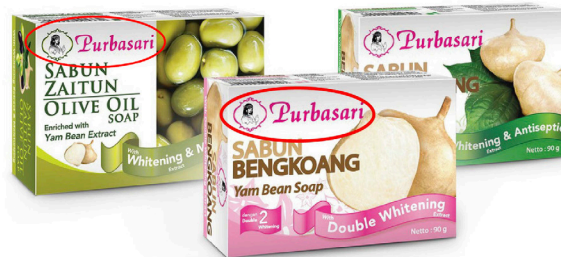
Gambar 6. Analisa Visual Aneka Produk Sabun Purbasari