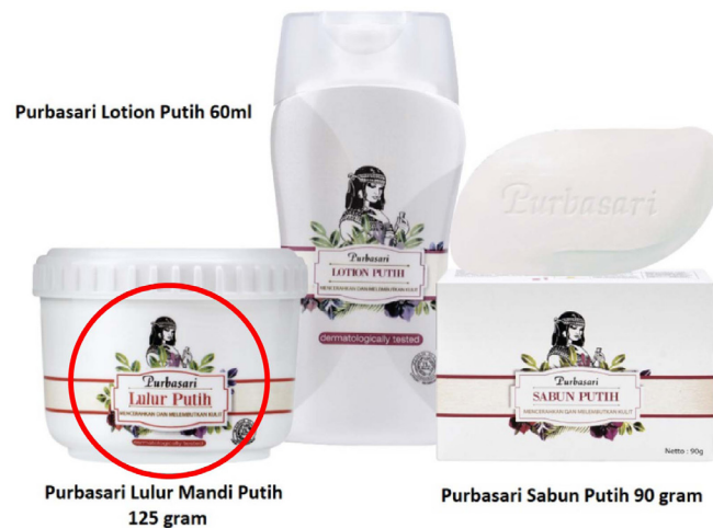
Gambar 4 Analisa Visual Produk Lulur, Sabun, Lotion Putih Purbasari.

Lidwell, Kritina Holden, dan Jill Butler sebuah logo harus memiliki konsistensi estetika yaitu konsistensi dalam penerapan gaya atau biasa disebut style pada sebuah logo. Sehingga jika dilihat secara keseluruhan dari semua produk-produk Purbasari, terdapat kesatuan di dalamnya. Contoh pertama yaitu pada produk lulur, sabun, lotion putih purbasari (Gambar 4) bingkai yang menjadi ciri khas dari logo hilang. Sama halnya dengan produk pada gambar 5 yaitu produk lulur mandi susu purbasari. Permasalahan pada produk purbasari soap yaitu logo purbasari diterapkan dengan format horizontal dan penerapan warna bingkai yang berbeda-beda. Dan permasalahan inkonsistensi yang terakhir yaitu pada gambar 7 informasi dari produk diletakan di dalam logo.