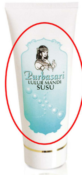
Gambar 5 Analisa Visual Produk Lulur Mandi Susu Purbasari.