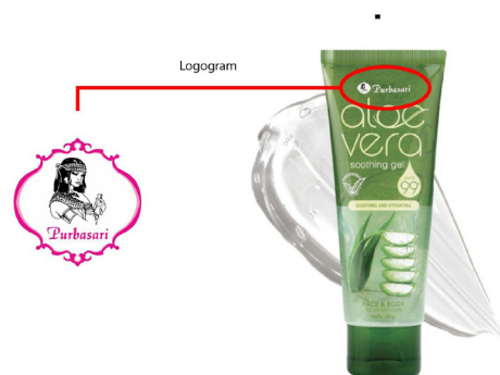
Gambar 3 Analisa Visual Produk Aloe Vera Soothing Gel Purbasari Kemasan 110gr Purbasari.

Setelah melalui hasil observasi identitas dari entitas Purbasari, telah ditemukan adanya beberapa permasalahan dalam identitas visual. Yang pertama yaitu mengenai kompleksitas. Secara logogram , gambar putri pada logo Purbasari tidak memiliki adanya kesederhanaan, dengan kata lain logo memiliki kompleksitas yang tinggi. Hal ini akan menjadi kendala ketika logo diaplikasikan pada media-media khususnya pada media yang kecil. Dibuktikan pada produk Aloe Vera Soothing Gel Purbasari kemasan 110gr, karena memiliki logo yang terlalu kompleks ketika diaplikasikan pada media tersebut logo menjadi sulit dideteksi.