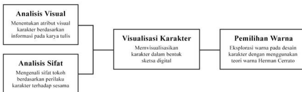
Gambar 2 Skema Metodologi untuk Desain Karakter Novel FBI vs CIA

Penulis melakukan analisis terhadap petunjuk sifat dan penampilan visual karakter pada novel FBI vs CIA . Analisis sifat dikerjakan dengan mencari dan menggunakan informasi yang menunjukkan sifat karakter, yaitu tingkah laku karakter terhadap sesama. Kemudian, analisis visual digunakan untuk menentukan atribut visual karakter berdasarkan deskripsi novel, yaitu perawakan dan pakaian yang dikenakan. Penulis menemukan persamaan dan perbedaan pada karakter melalui informasi yang dikumpulkan. Informasi tersebut digunakan untuk melakukan visualisasi pada karakter secara digital dan menggunakan teori warna Herman Cerrato sebagai panduan dalam pemilihan skema warna.