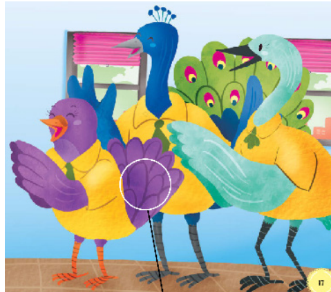
Gambar 3: unsur garis untuk membentuk objek bulu dalam Buku “Ayo Bersemangat!”.