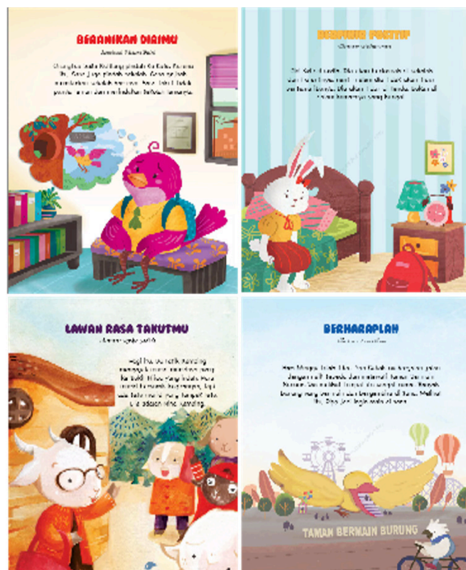
Gambar 2: Gaya ilustrasi setiap bab cerita dalam Buku “Ayo Bersemangat!”

Secara keseluruhan gaya gambar ilustrasi disetiap halaman pada buku tersebut mempunyai penyajian ilustrasi yang berbeda-beda pada setiap isi bab cerita serta penggambaran ilustrasi dibuat penuh.