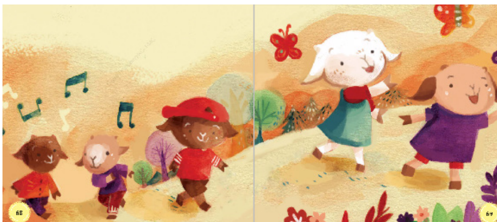
Gambar 4: unsur tekstur dalam Buku “Ayo Bersemangat!”.

Gaya gambar ilustrasi yang digunakan dalam buku ini memiliki unsur tekstur semu. Tekstur semu hadir karena adanya penggunaan brush tertentu, seperti tipe chalk atau kertas pada permukaan gambar ilustrasi sehingga kualitas visual tekstur pada ilustrasi dicapai dapat lebih optimal. Dalam hal lain tekstur pada buku cerita dapat memberikan kesan menarik, dan unik.