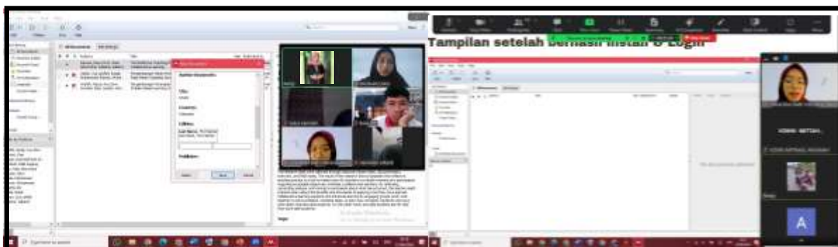
Gambar 2. Pelaksanaan Kegiatan Pelatihan Aplikasi Mendeley

Penggunaan aplikasi Mendeley dalam hal ini akan sangat membantu peserta yang masih berstatus sebagai mahasiswa dalam mengerjakan tugas-tugas kuliah dan atau laporan akhir/skripsi. Pemateri pada pelatihan ini memantau dan memastikan setiap peserta kegiatan sudah mampu melakukan instalasi serta menggunakan aplikasi Mendeley. Pemateri menunjukkan cara membuat sitasi dan menulis referensi dalam karya ilmiah, seperti artikel. Selanjutnya, peserta diminta untuk berlatih dan melakukan share screen agar tim pelaksana kegiatan dapat memastikan bahwa peserta mampu menggunakan aplikasi Mendeley dengan baik dan mengetahui kendala yang dihadapi selama penggunaan aplikasi tersebut. Pengetahuan mengenai sitasi sangat penting karena aplikasi ini akan mengacu pada nama penulis artikel, buku, atau referensi yang akan disitasi dalam karya ilmiah mahasiswa atau penulis (Hanafiah, Sauri, Mulyadi, & Arifudin, 2021). Pelaksanaan kegiatan dapat dilihat pada Gambar 2.