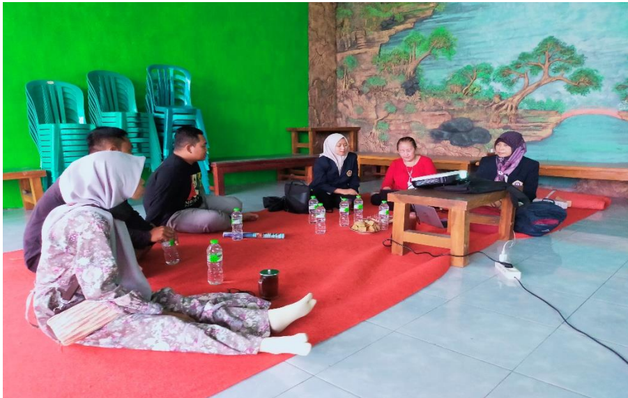
Gambar 1. Pelatihan Perencanaan dan Pengembangan Usaha