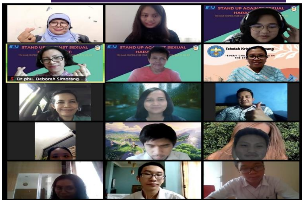
Gambar 1. Pamflet dan peserta webinar “Tips Terhindar dari Kekerasan Seksual”

Menjelang akhir webinar ini, panitia juga mengumumkan kompetisi mendatang, “ Creative Arts Against Sexual Harassment ”, yang segera dibuka dan pengumuman pemenangnya dilakukan sebulan kemudian. Kompetisi ini merupakan tahap kedua dari “ Stand Up Against Sexual Harassment ”. Panitia kemudian segera mem- posting brosur tentang kompetisi ini di media sosial. Peserta diminta untuk mengirimkan karya seni yang bertemakan pelecehan seksual. Pendaftaran dilakukan dengan memposting karya seni mereka di Instagram menggunakan template dan tagar tertentu seperti yang diinstruksikan.