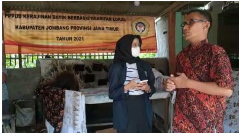
Gambar 2. Brainstorming dan diskusi CRM antara mitra dan anggota tim pelaksana mahasiswa