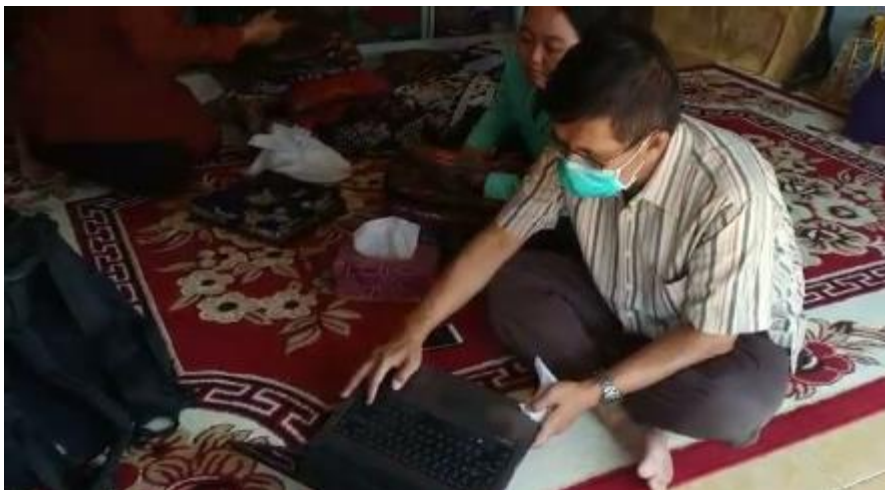
Gambar 1. Pendampingan CRM Pemanfaatan media online ( website batikcoletcombang.com)

Dalam pendampingan kepada mitra, tim pelaksana menyampaikan bahwa CRM diawali dengan kegiatan pengumpulan data customer dari buku tamu. Buku tamu memuat data pelanggan potensial yang meliputi nama calon pelanggan, alamat, nama kantor, nomor telpon, tujuan/kepentingan, saran dan kritik. Secara periodik setiap tiga minggu sekali data konsumen potensial dan pelanggan eksisting tersebut dipetakan pelanggan yang sangat potensial menjadi pelanggan untuk kedepannya. Berangkat dari database pelanggan tersebut, mitra diarahkan untuk menganalisa dan memprosesnya menjadi informasi yang bisa menolong mitra dalam menyusun perencanaan program CRM dan loyalitas pelanggan. Dari sini mitra dapat mengklasifikasikan pelanggan yang menjadi sasaran utama yang nantinya diberikan penawaran spesial dari perusahaan. Pada implementasi CRM, mitra didorong untuk memaksimalkan penggunaan saluran online misalnya website batikcoletjombang.com, facebook , email , dan whatsapp agar lebih mudah untuk mengembangkan relationship dengan pelanggan guna berbagi informasi dengan customer .