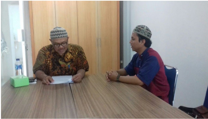
Gambar 3. Wawancara