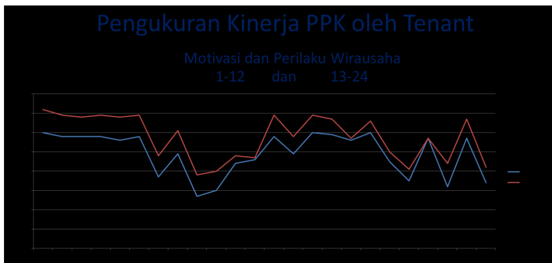
Gambar 2 Analisis Pre Post Terhadap Motivasi dan Perilaku Wirausaha Tenant PPK