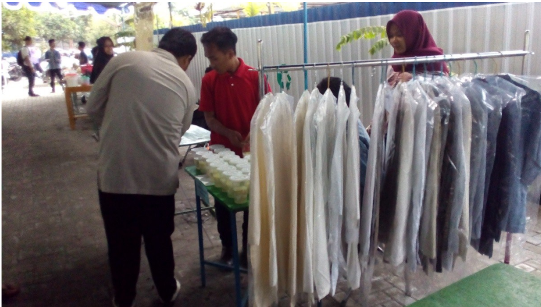
Gambar 7. Bazar UAD