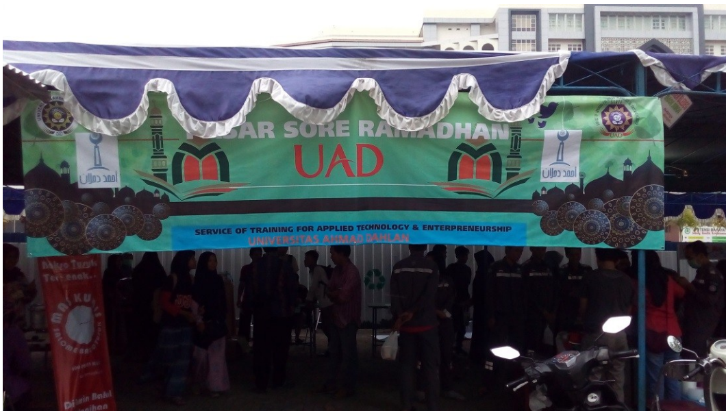
Gambar 8. Pasar Sore Ramadhan 2018