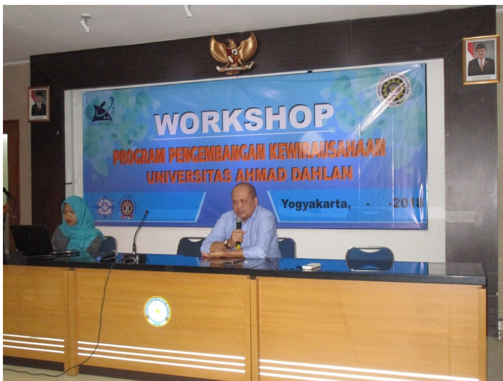
Gambar 6. Seminar pengembangan jaringan bisnis dan motivasi