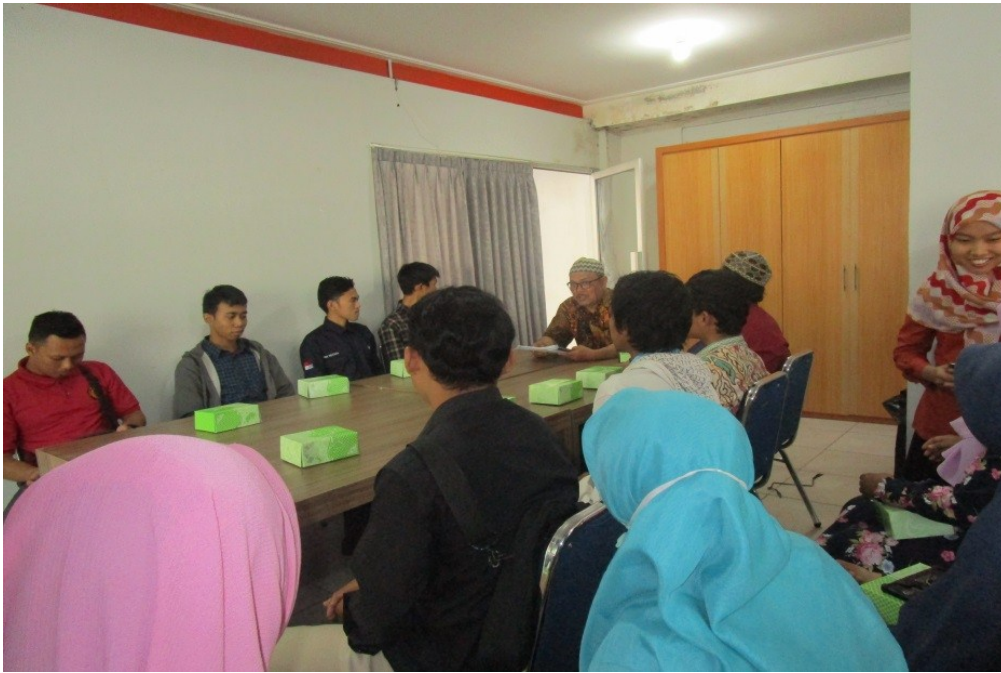
Gambar 5. Pengkondisian Tenant