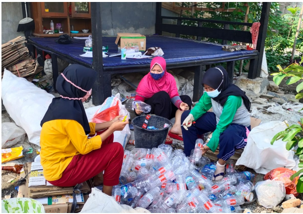
Aksi (Action!) Warga RW 10 Semper Timur oleh Phebe Valencia dan Ruth Euselfvita Oppusunggu Universitas Pelita Harapan