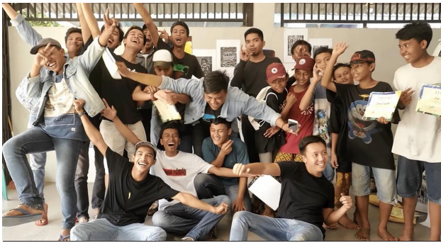
Foto Sampul Jurnal Strategi Desain & Inovasi Sosial Volume 1 Edisi 1

Festival Kreativitas Anak2 dan Muda/i Kampung Pondok Pucung: AMBREG 1, Desember 2017. Kolaborasi: Anak2 dan Muda/i RT 005 dan 006, RW 02, Kampung Pondok Pucung, Tangerang Selatan, Mahasiswa/i Program Studi Desain Interior, kelas Design, Society and Environment, dan Design as Generator (DAG).