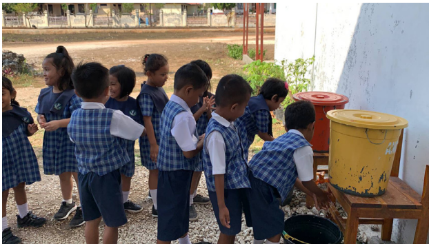
Foto Sampul Jurnal Strategi Desain & Inovasi Sosial Volume 2 Edisi 1

Berbaris menanti giliran cuci tangan sebelum memulai aktivitas belajar di SLH Rote.