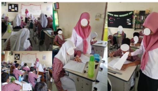
Gambar 1. Pelaksanaan asesmen berbasis open-ended mathematics problems

Dari hasil observasi keseluruhan proses asesmen, diperoleh hasil bahwa guru perlu memberikan stimulasi lebih agar siswa dapat memunculkan aspek kebaruan ( novelty ). Stimulasi yang dimaksud dapat berupa contoh-contoh soal open-ended atau pertanyaan-pertanyaan pemancing dalam rangka membiasakan siswa berpikir divergen. Saat pelaksanaan asesmen, guru telah berusaha memfasilitasi siswa yang masih kesulitan. Proses pelaksanaan asesmen disajikan pada Gambar 1.