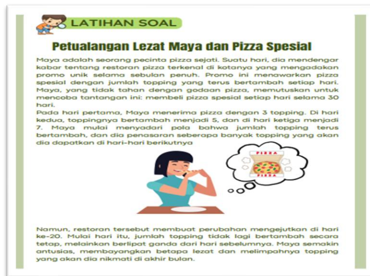
Gambar 2. Latihan Soal

Tahap desain dalam pengembangan LKPD berbasis pendekatan matematika realistik untuk materi barisan dan deret melibatkan beberapa langkah utama. Pertama, dilakukan penyusunan rancangan LKPD yang sesuai dengan prinsip RME, yang menekankan pentingnya menggunakan konteks kehidupan nyata sebagai jembatan antara materi pembelajaran dan pengalaman siswa. Rancangan LKPD ini mencakup struktur yang sistematis, mulai dari tujuan pembelajaran hingga soal – soal berbasis konteks untuk memecahkan masalah nyata. Langkah berikutnya adalah pemilihan konteks kehidupan nyata yang relevan dan menarik bagi siswa. Adapun contoh dari soal tersebut adalah: