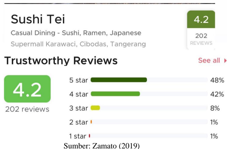
Gambar 1. Rating Customer Sushi Tei Supermal Karawaci

Walaupun sedikit yang memberikan rating 1 dan 2 akan tetapi hal ini menunjukkan bahwa masih terdapat ketidakpuasan pelanggan mengenai pengalaman bersantap di Sushi Tei Supermal Karawaci. Hal ini harus segera ditindaklanjuti agar tidak terjadi penyebaran word of mouth yang negatif di mana hal ini dapat mengakibatkan turunnya willingness to pay Sushi Tei. Selain fenomena di atas, Tabel 1 dibawah menunjukkan bahwa terdapat penurunan brand index Sushi Tei sebesar 2,1 % pada tahun 2019.