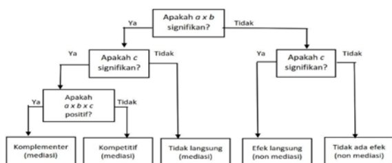
Gambar 3.2 Tipologi Media

Menurut Zhao et al. (2010) terdapat lima tipe mediasi. Mediasi komplementer yaitu terdapat efek yang di mediasi ( a \times b ) dan efek langsung ( c ) dan menunjuk pada arah yang sama. Mediasi kompetitif yaitu terdapat efek mediasi ( a \times b ) dan efek langsung ( c ) dan menunjuk ke arah yang berlawanan. Mediasi tidak langsung yaitu terdapat efek yang di mediasi ( a \times b ), tetapi tidak ada efek langsung. Nonmediasi langsung yaitu terdapat efek langsung ( c ), tetapi tidak ada efek tidak langsung. Nonmediasi tanpa efek yaitu tidak ada efek langsung maupun efek langsung.